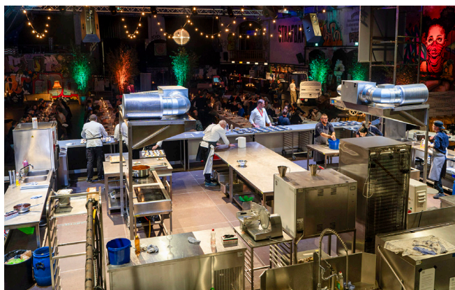
Die grosszügig ausgestattete Küche in der Berner Reithalle bot eine beeindruckende Kulisse.