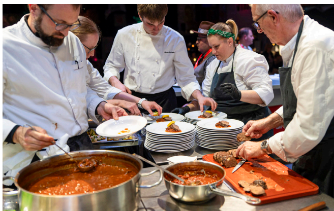
Der Hauptgang wird von einem Jurymitglied als bester «Grosis Hackbraten» bezeichnet, den er je gegessen habe.